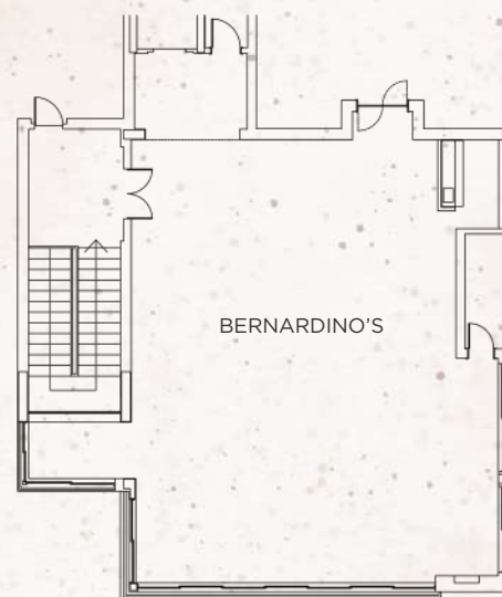
PISO | FLOOR 2