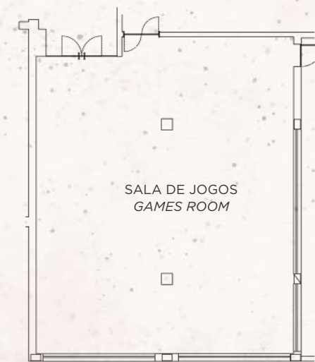
PISO | FLOOR 0