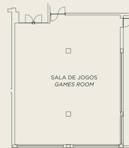
PISO | FLOOR 0