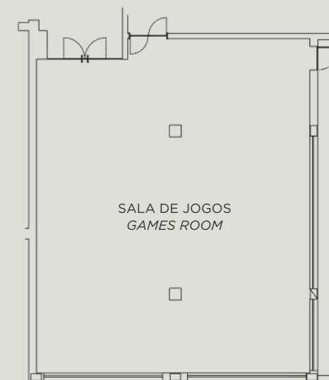
PISO | FLOOR 0